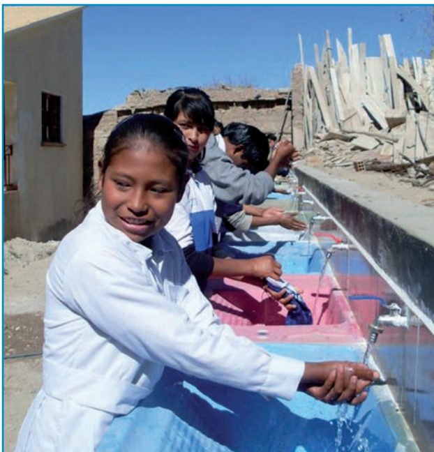
Wasplaatsen voor internaat in Vitichi juni 2011.

In juni werden op het internaat in Vitichi, dat onderdak biedt aan ca. 50 scholieren, 10 wasplaatsen en een waterpomp in gebruik genomen. De toiletten kunnen dankzij de nieuwe pomp weer doorgespoeld worden en men beschikt nu over voldoende wasgelegenheden.