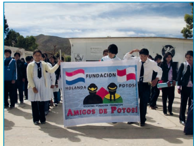
Een warm onthaal op de middelbare school in Vitichi.