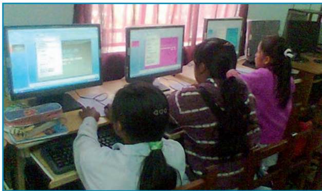
Computers en internet, een enorme stap voorwaarts!