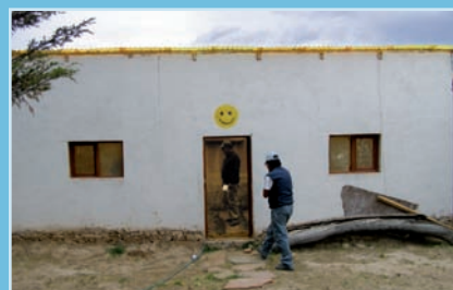
Zingende schoolkinderen op het plein. Foto midden: Solardouche installatie op het dak in Negro Tambo. Foto rechts: Groentekas