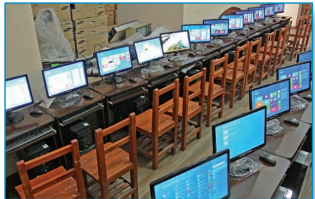
bibliotheek werd mediatheek

Een jaar nadat we de toezegging deden, zijn de 20 computers met internet gerealiseerd op "Pichincha" (college voor 800 leerlingen) in Potosí. Met dank aan de (nu) 3e klassers van het Praediniusgymnasium in Groningen die € 5.252 inzamelden! Naast onze donateurs, hebben ook de Van Leerstichting, de Jephcott Foundation, de stichting Colour4Kids en COTAP (de internet-provider), geholpen om dit tot stand te brengen. Dit is een geweldige stap voorwaarts voor het onderwijs in Potosí en biedt de (mijnwerkers) jeugd ongelooflijk veel meer kansen. De stad Potosí heeft 15 computers geschonken en de leerlingen hebben er 8 gewonnen met een wedstrijd zodat er nu 43 in totaal staan. Kijk, zo komen ze ergens!