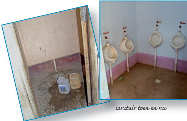
sanitair toen en nu