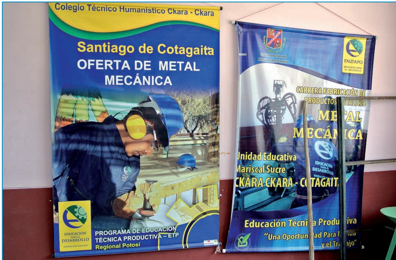
Fautapo: werk door scholing