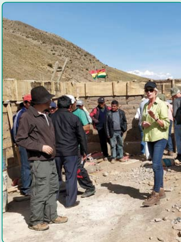
Schoolgroentekas in aanbouw. Inmiddels is ook het dak geplaatst.

Na een paar dagen acclimatiseren in de heerlijke hoofdstad Sucre (op 2.800 m.) maakten we een schitterende 2daagse wandeling in de bergachtige omgeving: Los Frailles. Vervolgens naar Potosí waar we begonnen met een bezoek aan het project in Laja Tambo om de bouw van de schoolgroentekas te bekijken. Er wachtte ons een allerhartelijkste ontvangst met muziek, dans (pittig op deze hoogte!) toespraken, voordrachten en een feestelijke lama-maaltijd in het centro comunitario dat we hier vorig jaar hebben gerealiseerd. Zowel het centrum met de schoolkeuken als het bijbehorende sanitair worden goed gebruikt en zien er keurig onderhouden uit. De trotse inwoners/bouwers en schooldirecteur leidden ons rond in de kas in aanbouw.