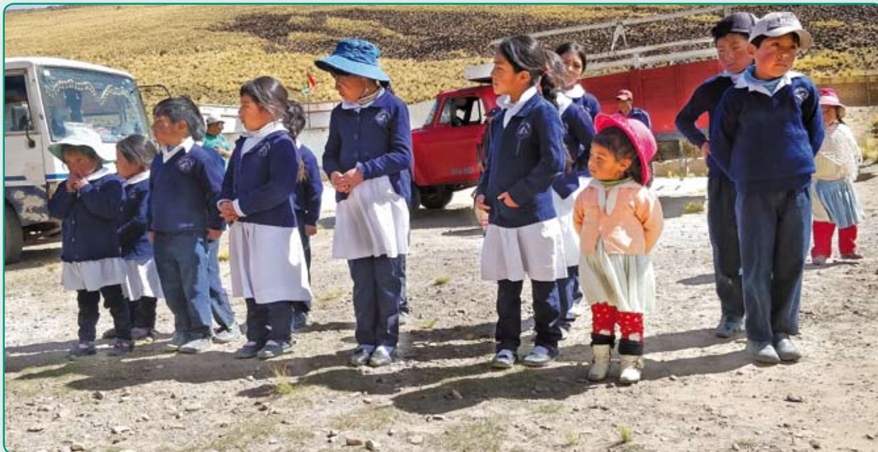
De jongste scholieren van Laja Tambo.