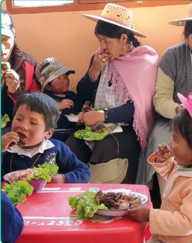
Foto boven: Gewoonlijk eten ze bonen en aardappelen. Omdat het feest is, is er vlees (lama) en sla. Als de kas klaar is, is er bijna dagelijks groente!